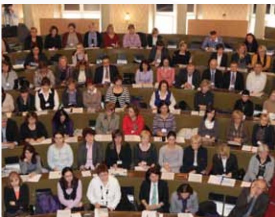
Konferencija "Sigurnost u odgojno-obrazovnim ustanovama" (2010. i 2015.)