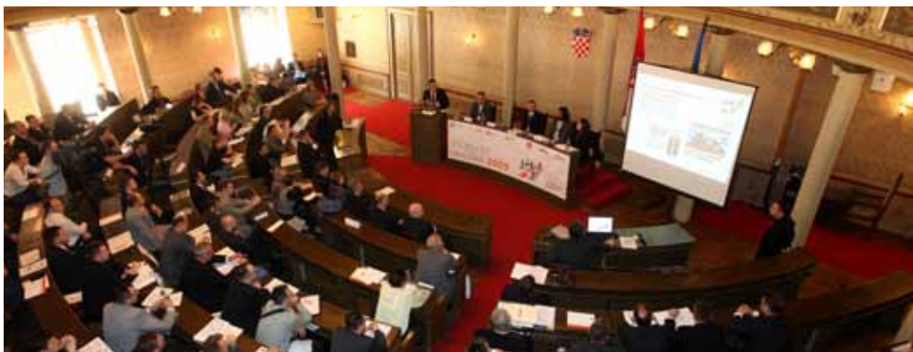
Već osma konferencija "Sigurnost gradova" (održane 2009., 2010., 2011., 2012., 2013., 2014., 2015., 2016. i 2017.)