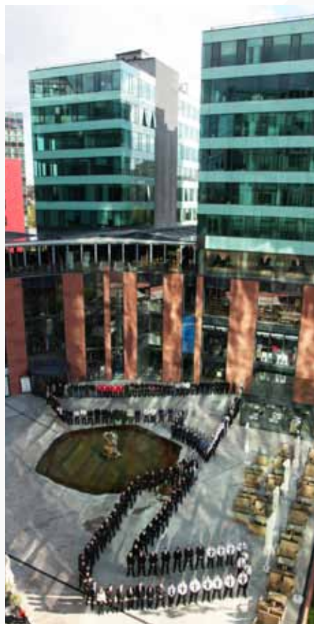
Milenijska fotografija hrvatskih zaštitara (Zagreb, 2012.)

TECTUS d.o.o. edukacija nakladništvo konferencije